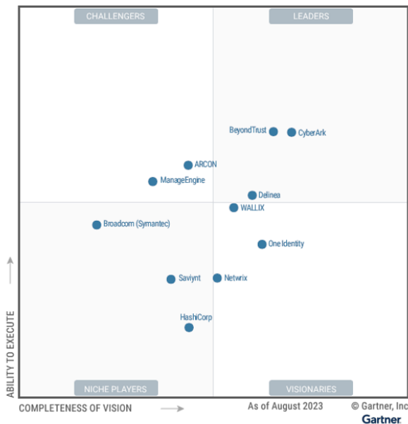
Figure 1: Magic Quadrant for Privileged Access Management